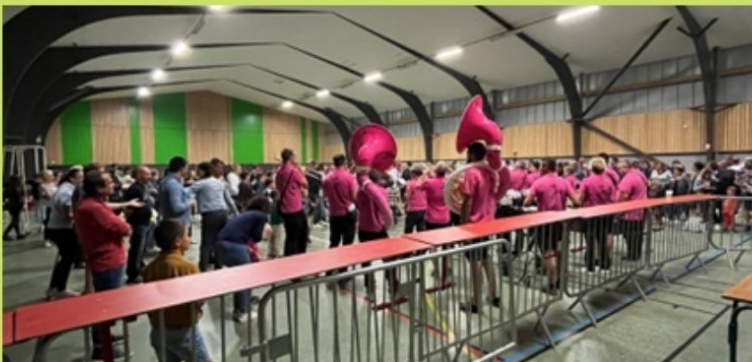
FETE DE LA MUSIQUE le samedi 25 juin organisée par le Comité des Fêtes