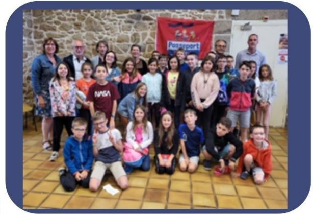
SOIREE DE CLOTURE du Passeport du Civisme 2021-2022 le vendredi 24 juin organisée par la municipalité