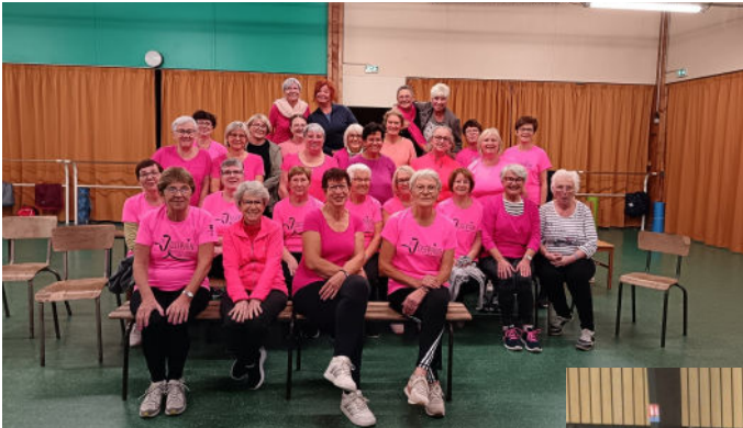
Les associations GYM DETENTE ET FIT'LAND ont participé à Octobre Rose