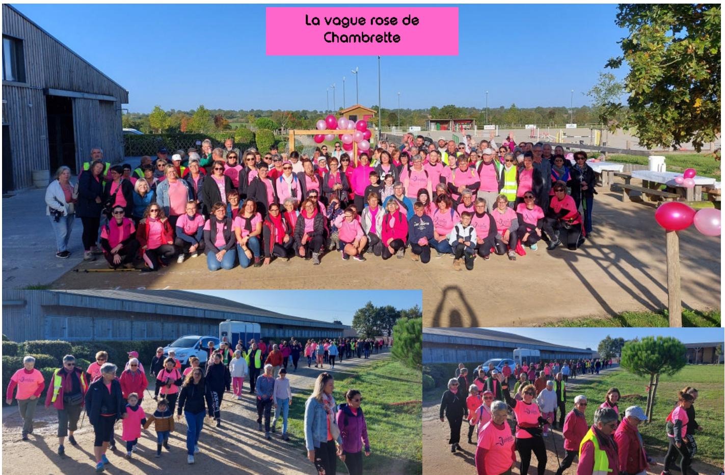
La vague rose de Chambrette