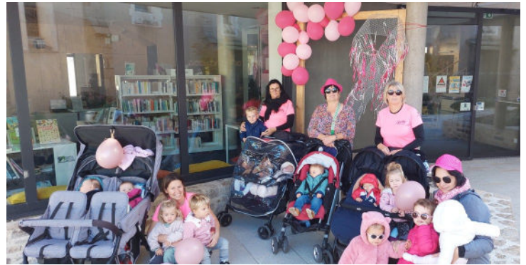
Les Assistantes maternelles ont fait une balade en rose avec les enfants